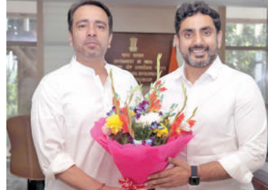
కేంద్ర విద్యాశాఖ సహాయమంత్రి జయంత్ చౌదరిని కలిసిన మంత్రి నారా లోకేశ్

మంగళగిరి, అక్టోబర్ 23, ప్రభాతవార్త : రాష్ట్రంలోని పాఠశాలల్లో కొత్తగా అదనపు తరగతి గదులు ఏర్పాటు, మౌలిక సదుపాయాల కల్పనకు రూ.6,762 కోట్లు మంజూరు చేయాల్సిందిగా విద్య, ఐటీ, శాఖ మంత్రి నారా లోకేశ్ కేంద్ర ప్రభుత్వాన్ని కోరారు. ఇటీవల న్యూఢిల్లీలోని కేంద్ర విద్యాశాఖ సహాయమంత్రి జయంత్ చౌదరిని కలిసిన మంత్రి నారా లోకేశ్ రాష్ట్రంలోని పాఠశాలలకు సంబంధించి పలు వివరాలు తెలుసుకున్నారు. రాష్ట్రంలోని 32,818 పాఠశాలల్లో తరగతి గదుల మరమ్మత్తులు, టూలులెట్లు తాగునీటి వసతులకు రూ.4,141 కోట్లు, 7579 అదనపు తరగతి గదుల ఏర్పాటుకు రూ.2621 కోట్లు, అవసరమైన మొత్తంగా పాఠశాలల్లో మౌలిక సదుపాయాల కల్పనకు రూ.6762 కోట్లు మంజూరు చేయాల్సిందిగా విజ్ఞప్తి చేశారు. మంత్రి లోకేశ్ వివరాలు తెలుసుకుంటే జయంత్ చౌదరి సానుకూలంగా స్పందిస్తూ... ఏపీలో సూక్ష్మ అభివృద్ధికి పూర్తి సహాయం, సహకారాలు అందిస్తామని హామీ ఇచ్చారు.