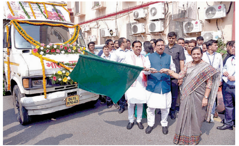
బుధవారం న్యూఢిల్లీలో భారత్ బ్రాండ్ పప్పుల వాహనాన్ని తెండా ఊపి ప్రారంభించిన కేంద్రమంత్రి ప్రకాష్ ఖోసా