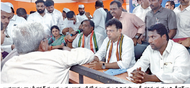
బుద్ధవారం గాంధీభవన్ మంత్రుల ముఖ్యమంత్రితో ప్రజల సమస్యలపై విన్నపాలు స్వీకరిస్తున్న మంత్రి శ్రీధర్ బాబు

హైదరాబాద్, అక్టోబరు 23, ప్రభాతవార్త: పోలీసు అభ్యర్థులకు జీవో 46 కారణంగా ఎర్రపత్రం నష్టం జరుగుతుంటే వారి పరిష్కారంకు సాధ్యమైన పాత్ర పోషించే అనేక అంశాలపై సీఎన్ తో సమావేశం ఏర్పాటు చేయాలని బాధితులు వారి సమస్యలను చెప్పకోవచ్చని రాష్ట్ర బడి పరిశ్రమలు, శాసనసభ వ్యవహారాల శాఖ మంత్రి మద్దిర్ శ్రీధర్ బాబు హామీ ఇచ్చారు. బుద్ధవారం గాంధీభవన్ లో మంత్రులతో ముఖ్యమంత్రి కార్యక్రమంలో శ్రీధర్ బాబు పాల్గొన్నారు. శ్రీధర్ బాబుతో ముఖ్యమంత్రి కార్యక్రమం ఉండని తెలిసి పెద్ద ఎత్తున ప్రజలు గాంధీ భవన్ కు వచ్చారు. ఆయనకు 328 విన్నపాలు సందర్భులకు నుంచి వచ్చాయి. పోలీసు అభ్యర్థులతో వారి సమస్యలను మంత్రి అడిగి తెలుసుకున్నారు. మీకు సి ఎన్ తో అపాయింట్ మెంట్ ఇప్పిస్తా మీకు సమస్యల పరిష్కారానికి ప్రభుత్వం ఏర్పాటు చేస్తుంది అని తెలిపారు. ప్రకలాంగులు, విఆర్ఎస్,