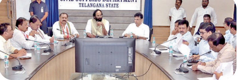
బుధవారం సభకమిటీ సమావేశ దృశ్యం

ఇ-కుబేర్ ద్వారా నేరుగా రైతు ఖాతాలోకి రూ. 500 బోనస్ వలపై కేబినెట్ సభకమిటీ నివేదిక సిద్ధం నేడు ముఖ్యమంత్రికి నివేదించనున్న కేబినెట్ సభ కమిటీ