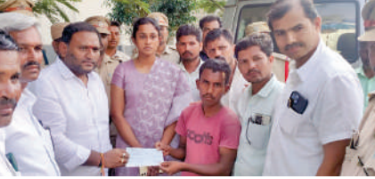
బాధిత కుటుంబానికి పది లక్షల చెక్కు అందిస్తున్న ఎమ్మెల్యే డా|| కంభం శ్రీకాంత్, డి.ఎఫ్.ఐ. భరణి

పిఎంకె తాండ్రలో ఘటన.. బాధిత కుటుంబానికి 10లక్షల ఆర్థికసాయం