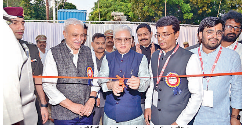
బుధవారం స్వదేశీ మేళాను ప్రారంభిస్తున్న గవర్నర్ జిష్ణుదేవ్ వర్మ

హైదరాబాద్, అక్టోబరు 23, ప్రభాతవార్త: తెలంగాణ వైద్య విధాన పరిషత్ (టీపీసీపీ) పరిధిలో ఉన్న జిల్లా, ఏరియా ఆసుపత్రుల్లో ఎక్కువ మంది రోగులు చికిత్స పొందుతున్నారనీ, అందుకు అనుగుణంగా అన్ని రకాల వైద్య చికిత్సలు అందుబాటులో ఉండాలని రాష్ట్ర వైద్య, ఆరోగ్య శాఖ మంత్రి దామోదర రాజనర్సింహు అన్నారు. భవిష్యత్తులో అవసరాలు, ఓపీ, ఐపీ, ఐడెన్ డ్రైవ్ ను దృష్టిలో ఉంచుకుని సరిహద్దులలో మార్పులు చేయాలని సూచించారు. ఈమేరకు డిపీపీసీ అధ్యక్షుల పనితీరు, సెకండరీ హెల్త్ కేర్ డైరెక్టర్లుగా బలోపేతం చేయడానికి అన్ని దశలను పూర్తిచేసిన ప్రతిపాదనలపై మంత్రి దామోదర ఆరోగ్య శాఖలోని హెల్త్ సెక్షన్ లోని డిపీపీసీ అధ్యక్షులతో సమావేశం చేయాలని సూచించారు. ఈమేరకు డిపీపీసీ అధ్యక్షులతో సమావేశం చేయాలని సూచించారు. ఈ సమావేశం నిర్వహించారు. కాగా, వాన్స్ కోవర్డ్ కాలనీలతో పాటు దానికి అనుబంధంగా ఉన్న ఎంజిఎం, సీకెం, ఓఎంహెచ్, టీడీ, కంటి దవాఖానాలపై మంత్రి సమీక్షా సమావేశం నిర్వహించారు.