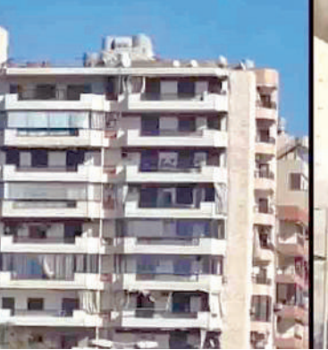
దేశంలోని అతిపెద్ద ప్రభుత్వ ఆసుపత్రిపై ఇటీవలే ఇజ్రాయెల్ దళాలు దాడి చేసాయి. 18 మంది చనిపోగా 60 మందికి పైగా బీరూట్ ఆసుపత్రిలో

స్పష్టమైన సమాచారం ఉందని ఐడిఎఫ్ కమాండర్లు తెలిపారు. హెజ్బోల్లా ముఖ్య ప్రతినిధి మహ్మద్ ఆఫీసివూట్లాడుతూ ప్రధాని బెంజమిన్ నెతన్యాహు నివాసంపై దాడికి ప్లాన్ చేసింది తామేనని ప్రకటించారు. సెసారియా ప్రాంతంలోని నెతన్యాహు నివాసంపై దాడిచేసామని అన్నారు. అయితే ఇజ్రాయెల్ దళాలు మాత్రం తమ ప్రధానమంత్రి అయిన భార్య ఆసనంలోనే లెబనన్ ప్రకటించింది.