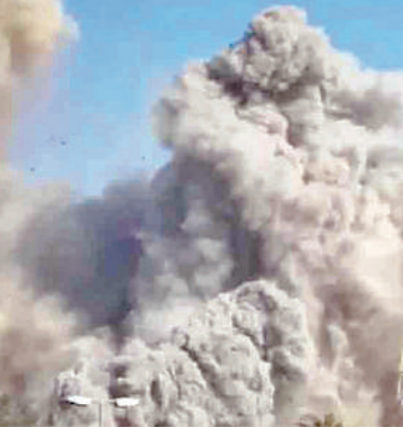
గాయపడ్డారు. తాము హెజ్బోల్లా టార్గెట్ గా మాత్రమే దాడులు చేస్తున్నట్లు ఇజ్రాయెల్ ప్రకటించింది.